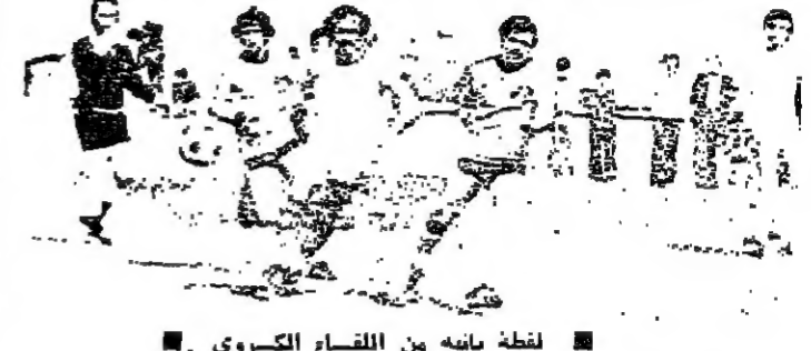
لظة ثانية من اللقاء الكروي .

شهد ملعب المدينة الرياضية بعد ظهر امس الاحد اول مباراة بكرة القدم بعد الحرب تقابل فيها فريق الطلائع ومنتخب طرابلس بقيادة الحكم الدولي سبيع نلاح واستمرت عن نوز الطلائع بثلاث اصابات مقابل اصابة واحدة للينخب .